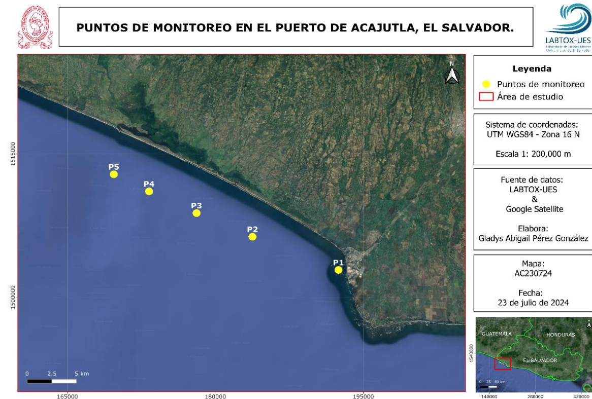
Figura 1. Puntos monitoreados para Mareas Rojas en la zona costera occidental del país, partiendo del puerto de Acajutla hasta Barra de Santiago. LABTOX-UES.

Las muestras fueron recolectadas por personal de LABTOX-UES con colaboración de CEPA-Acajutla el día 23 de julio del corriente año, se realizó recorrido en embarcación en playas del occidente del país, Figura 1. Adicionalmente, se registraron parámetros fisicoquímicos en cada punto, muestras para análisis de clorofila “a”, nitrógeno total y fósforo total fueron transportadas al laboratorio.