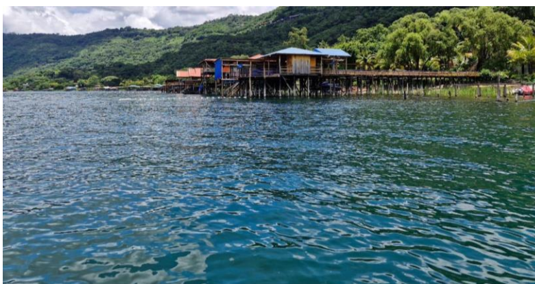
Figura 2. Característica ambiental observada en El Lago de Coatepeque del 13 de agosto de 2024. LABTOX-UES.

Durante el recorrido no se detectaron parches extensos de coloración verde en la superficie del agua indicativos de proliferación algal. (Ver Figura 2).