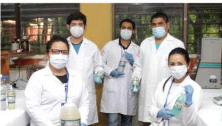
El Laboratorio para el desarrollo de productos químicos (LabProQ-CIMAT) recibió un reconocimiento por el consejo Nacional de Ciencia y Tecnología El Salvador.